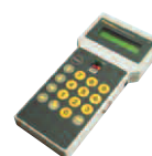
BUPC Unité de programmation