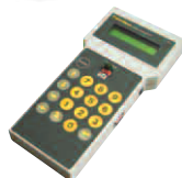
BUPC Unité de programmation